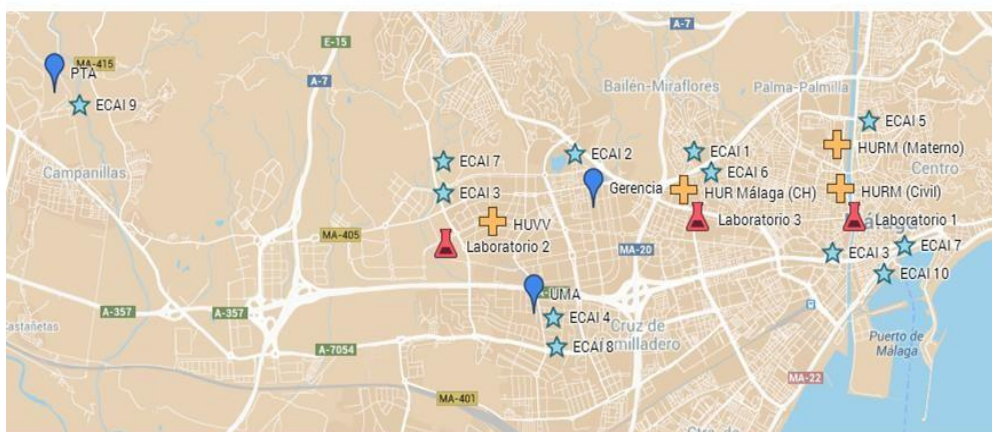
Distribución de las ECAI y laboratorios en el área metropolitana de la ciudad de Málaga.

La localización geográfica de las ECAIS de IBIMA se muestra en la figura adjunta: